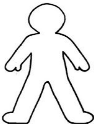
Ilustração: Caso a criança ou o adolescente apenas aponte a parte do corpo, que foi tocada ou violada, demonstre no desenho abaixo.

QUANDO PERTINENTE, INCLUIR RELATO DA EQUIPE ESCOLAR